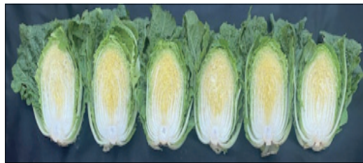
CMB 0 CMB 100 CMB 200 CMB 300 CMB 500 RHB 200