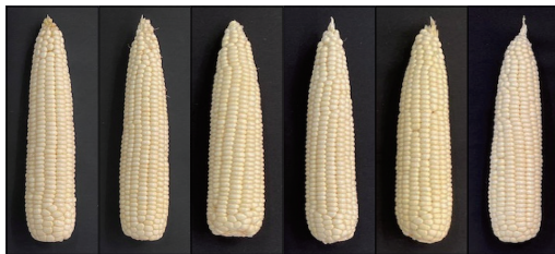
CMB 0 CMB 100 CMB 200 CMB 300 CMB 500 RHB 200