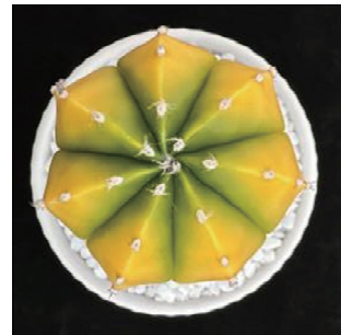
그림 10. 「골드아이」 품종

아스트로피툼 신품종 특성조사요령(국립종자원, 2018)에 의한 「골드아이」 품종의 주요 특성은 다음과 같다(그림 10, 표 9,10). 구형은 원형이며 RHS color chart 분석결과 주요색은 녹황색(6B)이고 2차색은 진녹황색(151C)인 복색 품종이었다. 대조품종과 달리 식물체 표면에 흰색 털은 형성되지 않으며, 자구는 자연 발생하거나 모구 절단 시 생성되었다. 구고는 4.4cm, 구폭은 6.0cm이며 주당 자구 발생수는 8.2개로 대조품종보다 적은 경향을 보였다.