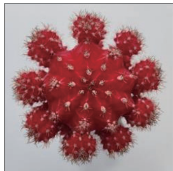
그림 2. 「레드참」 품종

「레드참」 품종은 구색이 적색이고 구의 형태는 편원형이며 자구가 모구의 전체에 균일하게 착생하여 기호도가 4.7로 우수하였다(그림 2). 비모란 신품종 특성조사요령(국립종자원, 2013)에 의한 특성은 구폭과 구고가 51.7mm와 32.9mm로 대조품종 43.5mm와 27.8mm에 비해 크다. 모구와 자구의 색은 45B인 적색이며, 능수는 8.6개로 결각의 깊이는 얕았다. 자구수는 주당 32.1개로 대조품종 20.9개에 비해 많았다. 가시는 갈색으로 반직립하고 가시의 길이는 3.7mm로 중간 정도였다. 가시자리의 모용은 많고, 가시자리 띠의 형성 정도는 강했다(표 1, 2).