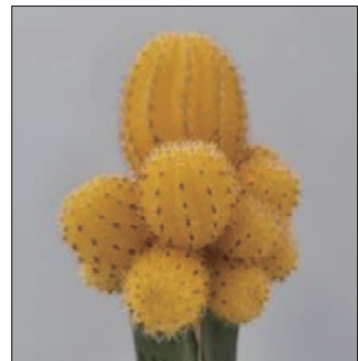
그림 8. 「골드참」 품종

「골드참」 품종은 그림 8과 같이 황색계 품종이다. 산취 신품종 특성조사요령(국립종자원, 2009)에 의한 주요 특성은 구형이 원주형이고 구폭은 32.4mm로 대조품종의 29.6mm에 비해 굵고 구고는 54.2mm로 수출포장에 적합한 길이였다. 모구와 자구의 색은 14A인 진한 황색이고 능수는 12.4개였으며, 자구의 수는 주당 7.5개로 많아 상품화 기간이 짧았다. 가시의 색은 흰색 바탕에 끝부분이 갈색이며 가시 길이는 3.0mm였다. 가시의 경도는 연하여 부드럽고 가시자리 모용의 크기는 중간 정도였다(표 7, 8).