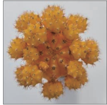
그림 4. 「엘로우참」 품종

「엘로우참」 품종은 구색이 황색이고 구의 형태는 편원형이며 기호도가 4.7로 우수하였다(그림 4). 비모란 신품종 특성조사요령(국립종자원, 2013)에 의한 주요 특성은 구폭이 47.7mm로 중간 정도이고, 모구와 자구의 색이 17C인 황색이며 능수는 8.2개로 결각의 깊이는 얇았다. 자구수는 주당 14.6개로 대조품종 18.1개에 비해 적었다. 가시는 갈색으로 반직립하고 가시의 길이는 4.3mm로 중간 정도였다. 가시자리의 모용은 중간 정도이고, 가시자리 띠의 정도는 약했다(표 1, 2).