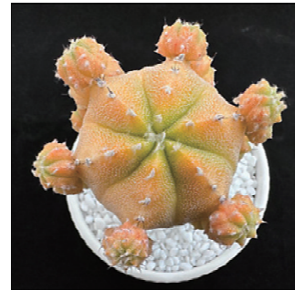
그림 12 「샤이스타」 품종

아스트로피툼 신품종 특성조사요령(국립종자원, 2018)에 의한 「샤이스타」 품종의 주요 특성은 다음과 같다(그림 12, 표 11,12). 구형은 원형이며 RHS color chart 분석결과 주요색은 주황색(24A)이고 2차색은 황녹색(138B)인 복색이었다. 모구에 매우 작은 흰색 털이 발생하며, 구고는 3.7cm, 구폭은 4.6cm로 대조품종보다 작았다. 주당 자구수는 13.6개로 생산력이 우수하며 대조품종과 달리 별도의 처리 없이도 자구가 발생했다.