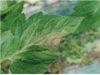
【잎마름역병 잎 앞면 증상】