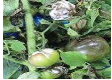
【잎마름역병 과실 증상】