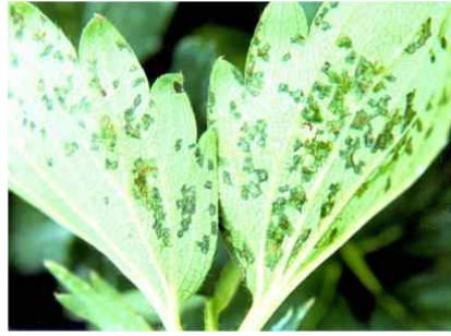
【발생초기 잎 뒷면 증상】