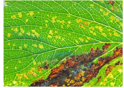
【발생후기 잎 증상】

○ 세균 누출액이 튀거나 접촉으로 번지는 원인이 되고 딸기 러너에 의해 확산됨