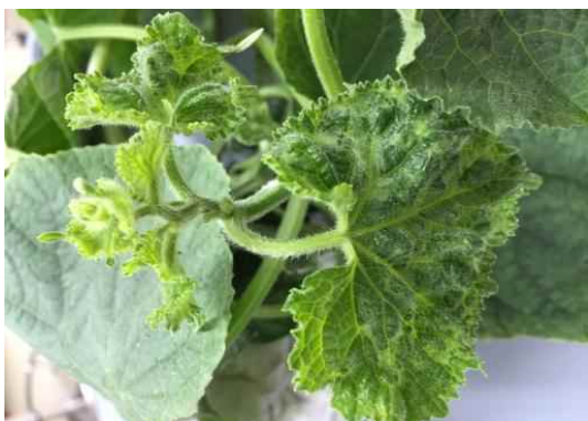
【오이 ZYMV 잎 증상】

⇒ 진딧물 방제를 철저히 하고 작물이 시설 내에 연중 재배되어 항상 전염원이 있으므로 즙액에 의한 접촉전염을 막기 위해 병든 식물체는 즉시 제거