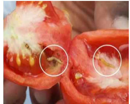
【과실을 파고들어간 유충】