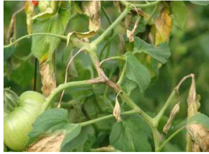
【잎마름역병 줄기 증상】