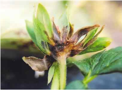
【세균모무늬병 꽃잎 증상】