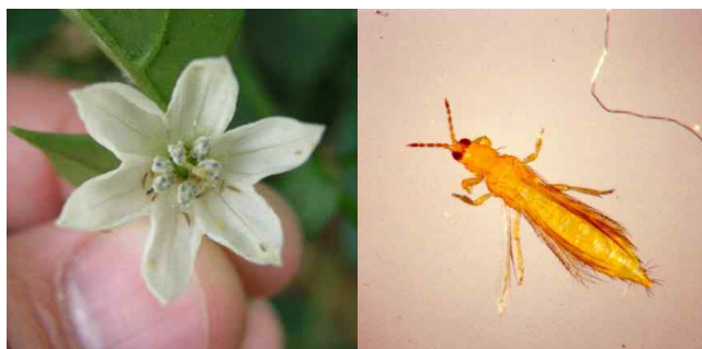
【병을 전염시키는 총채벌레】