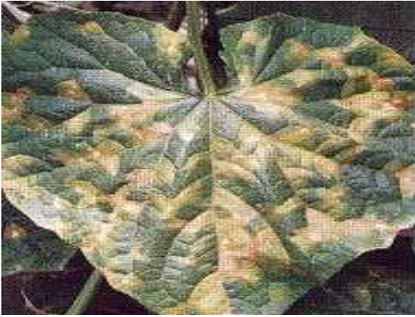
【오이 노균병 증상】