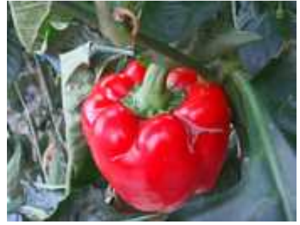
【꽃노랑총채벌레에 의한 꽃, 잎, 열매 피해】