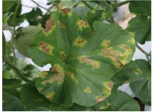
【멜론 노균병 증상】