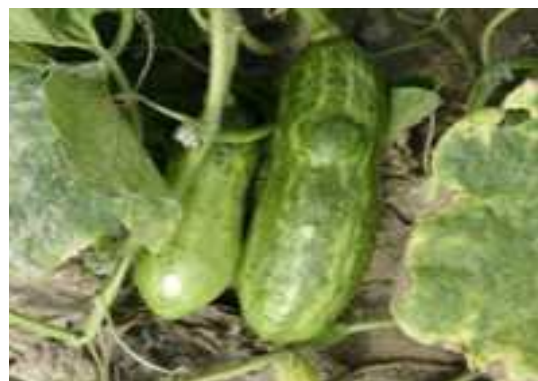
【호박 ZYMV 증상】