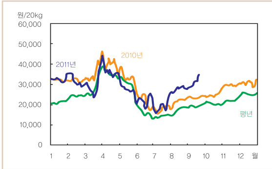
주: 일별 가격은 5일 이동평균치임. 평년 가격은 2006~2010년의 일별 가격 중 최대, 최소를 뺀 평균임. 자료: 서울특별시 농수산물공사.