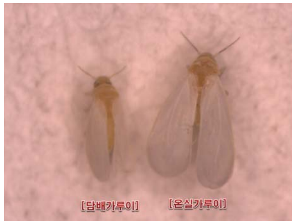
[담배가루이와 온실가루이 비교]