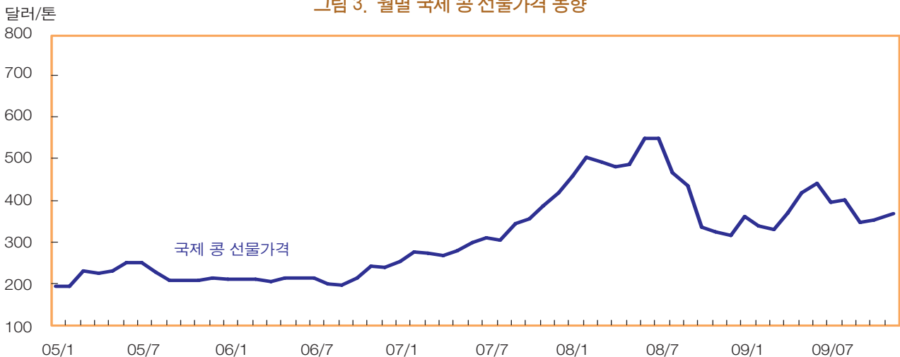
그림 3. 월별 국제 콩 선물가격 동향