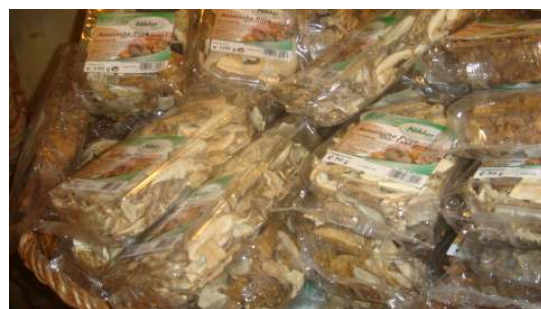
프랑크푸르트 버섯 판매 상품