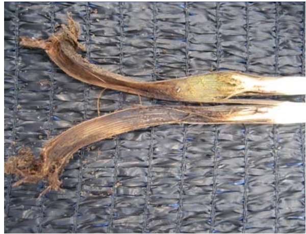
<작은뿌리파리 피해주 모습>