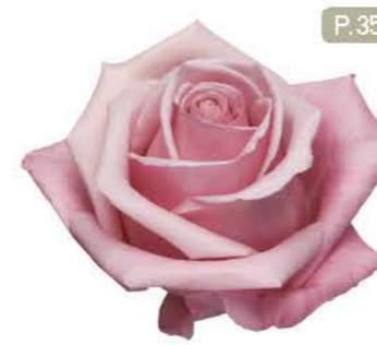
러블리베어 Lovely Bear