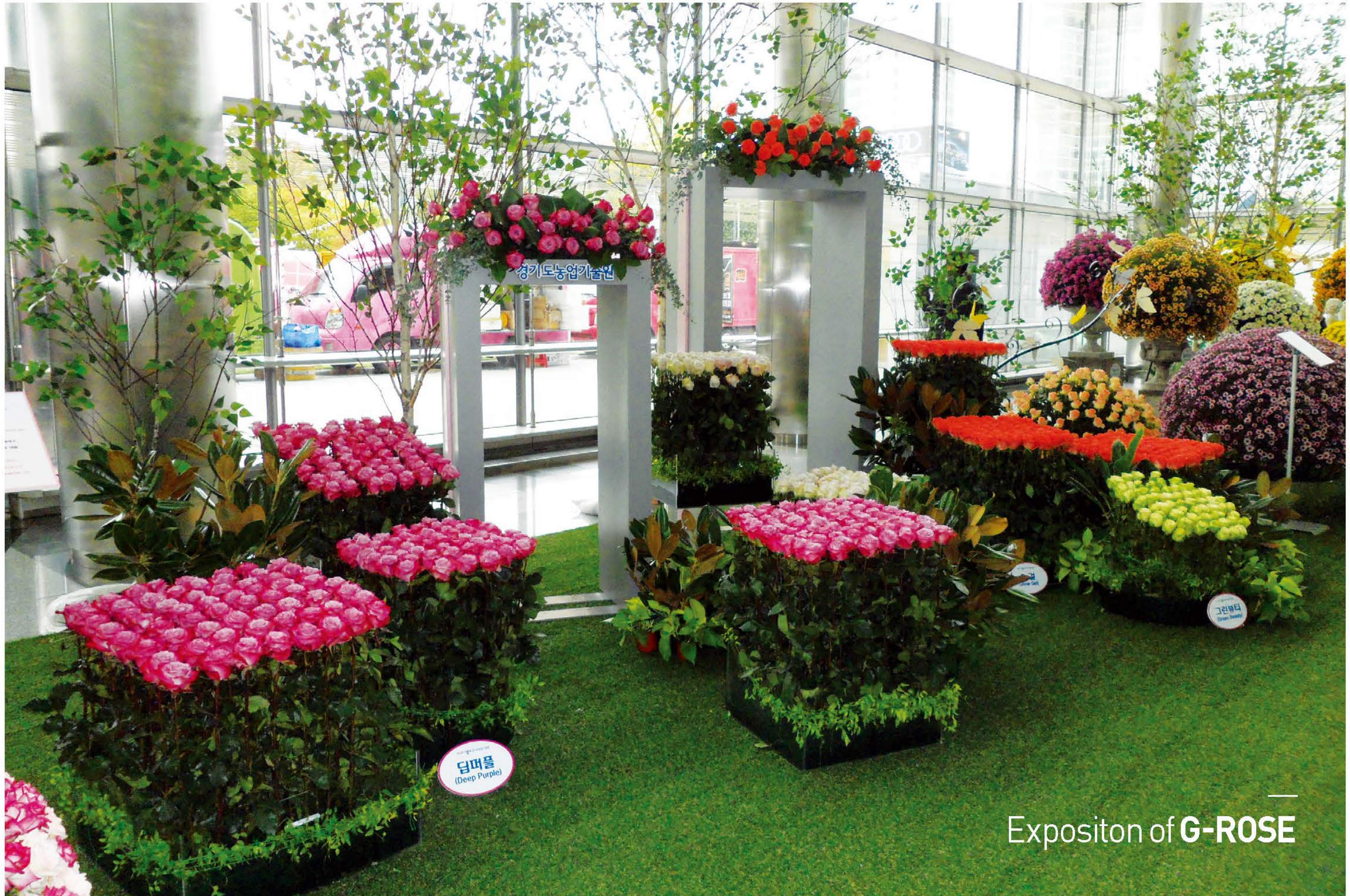
Exposition of G-ROSE