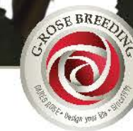
특이한 화형 / 다수성 Unique shape / Very good production

육성년도 Introduced | 2017 꽃크기 Size | 6~8cm 꽃잎수 Petals | 15~25매 절화길이 Stem Length | 50~70cm 절화수량 Production | 160~180본/m 2 /년(stems/m 2 /year) 절화수명 Vaselife | 10~12일(days)