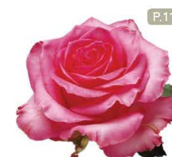
핑크콘도르 Pink Condor