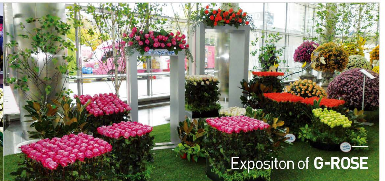
Expositor of G-ROSE