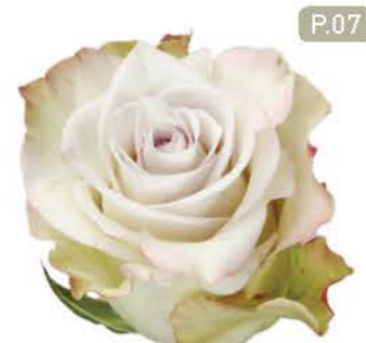
딥실버 Deep Silver