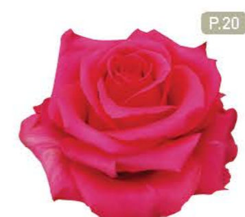
캔디파티 Candy Party