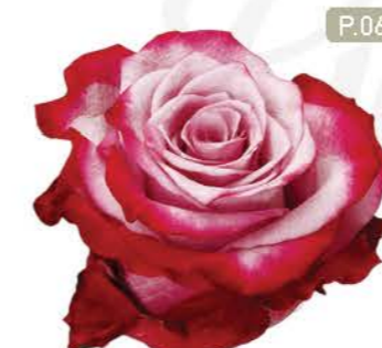
딥퍼플 Deep Purple