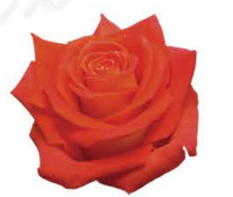
카프리썬 Capri Sun