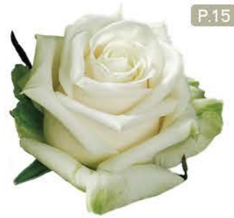
아이스베어 Ice Bear