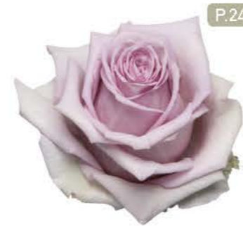
블루워터 Blue Water

G-ROSE BREEDING COLLECTION 2017-2018 MORE BEAUTIFUL G-ROSE BLOOM