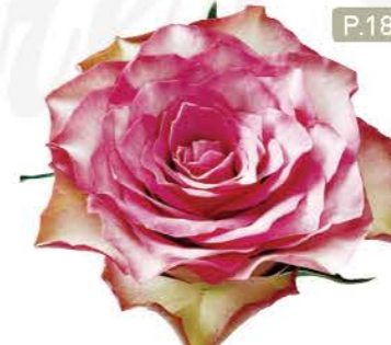
핑크하트 Pink Heart