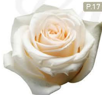
웨딩케이크 Wedding Cake