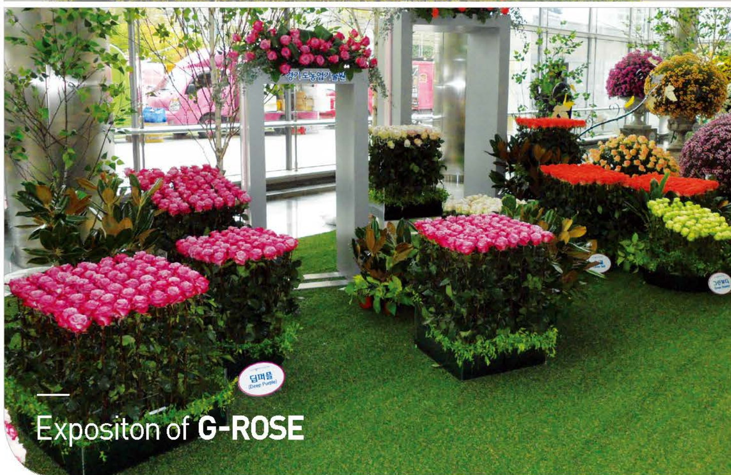
Expositon of G-ROSE