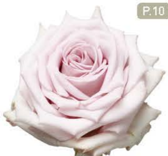
바운티웨이 Bounty Way