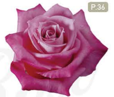
락파이어 Rock Fire