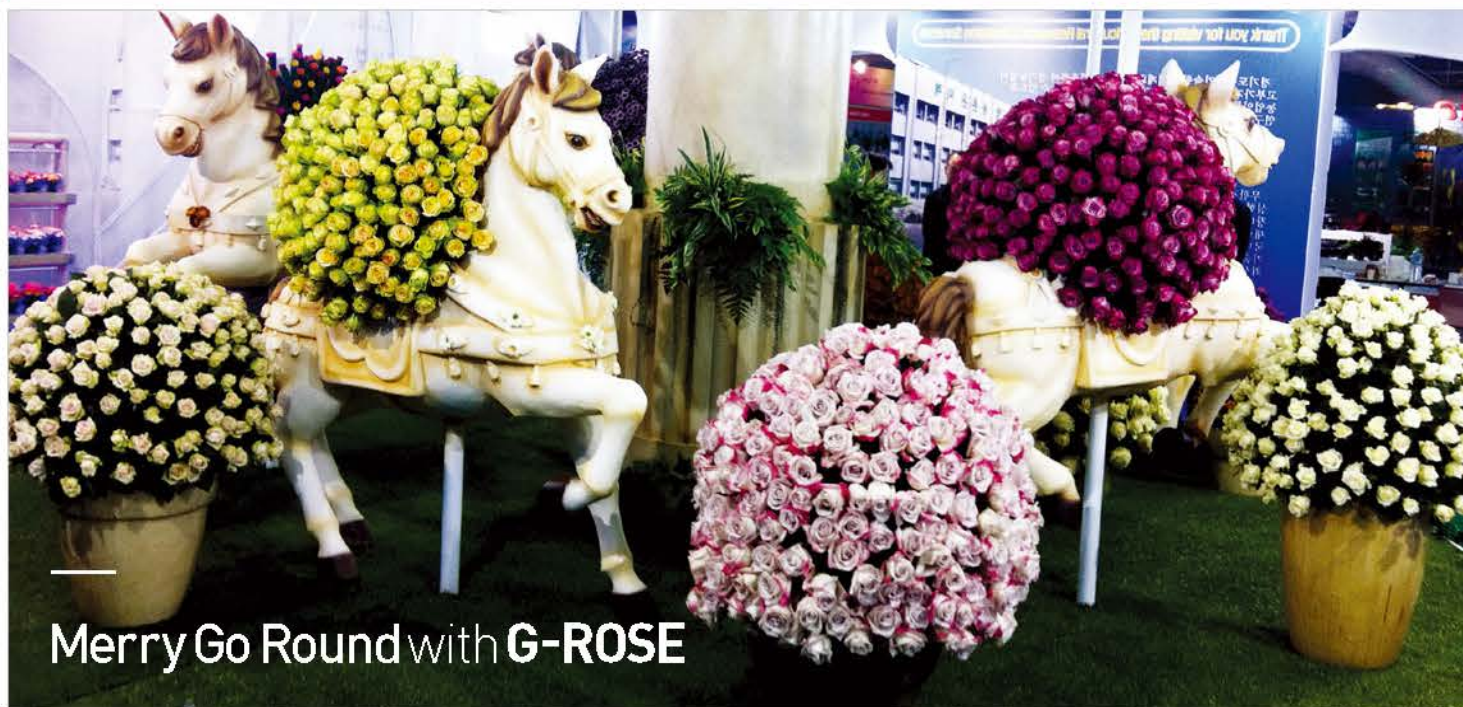
Merry Go Round with G-ROSE