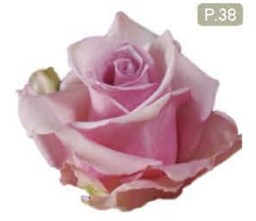
미씽유 Missing You