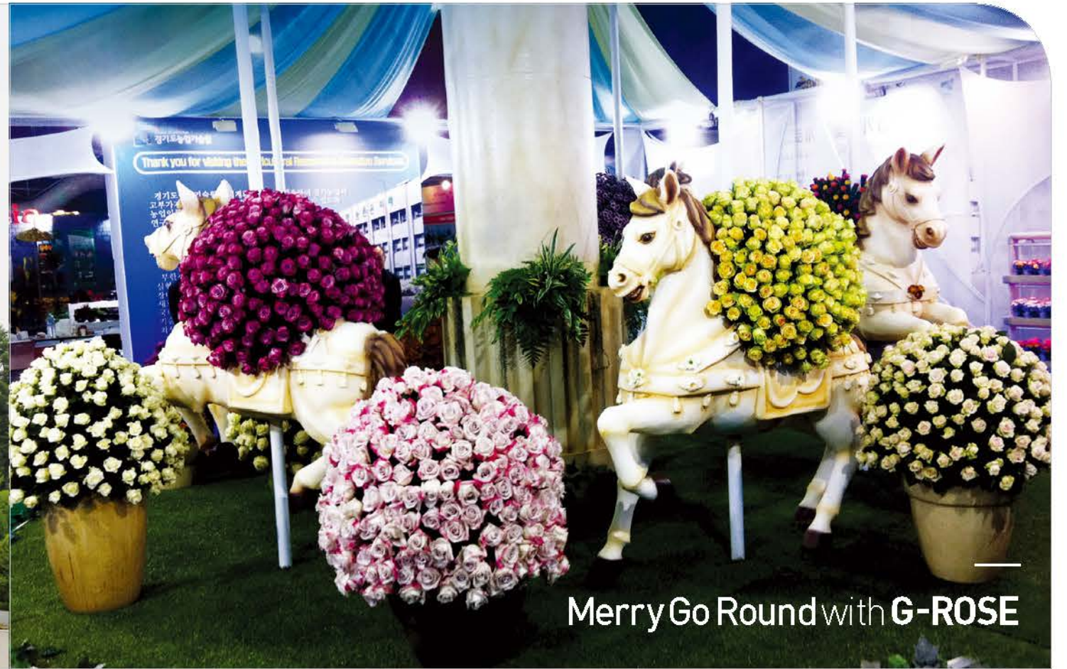
Merry Go Round with G-ROSE