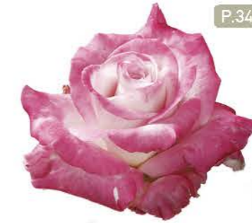
실버쉐도우 Silver Shadow