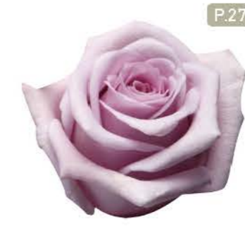
허니블루 Honey Blue