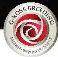
토마토타입 화형 / 절화장김 Tomato type / Long Stems

육성년도 Introduced | 2017 꽃크기 Size | 8~10cm 꽃잎수 Petals | 15~20매 절화길이 Stem Length | 60~80cm 절화수량 Production | 160~180본/m 2 /년(stems/m 2 /year) 절화수명 Vaselife | 10~12일(days)