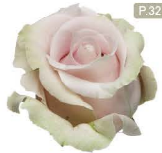
비너스베리 Venus Berry