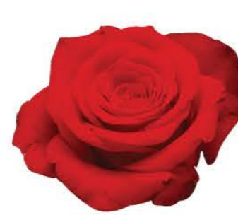
썸머레드 Summer Red